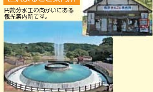
円筒分水工の向かいにある観光案内所です。