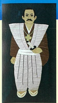
キリシタン武士の後藤寿庵