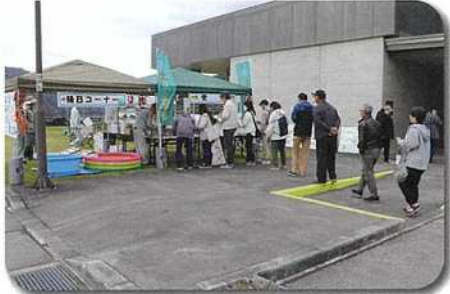
水土里の皆廊コーナーに並ぶ来場者

縁日コーナーでは、お菓子すくいやスーパーボールすくい、輪投げに夢中になる子どもたちの姿が印象的で、思い出に残る楽しいひとときとなったようです。