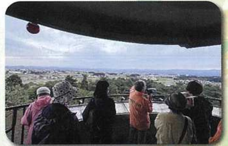
見分森展望台から望む黄金色の散居集落