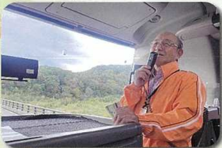
いさわ散居ガイドの会の車中説明の様子

参加者アンケートでは、全員が「参加して良かった」と回答。「ものすごく大満足のツアーでした」、「あたたかい説明で楽しかった」といった嬉しい声も多数寄せられ、好評のうちに終了しました。