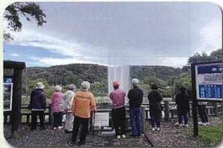
円筒分水工から噴水があがると歓声が