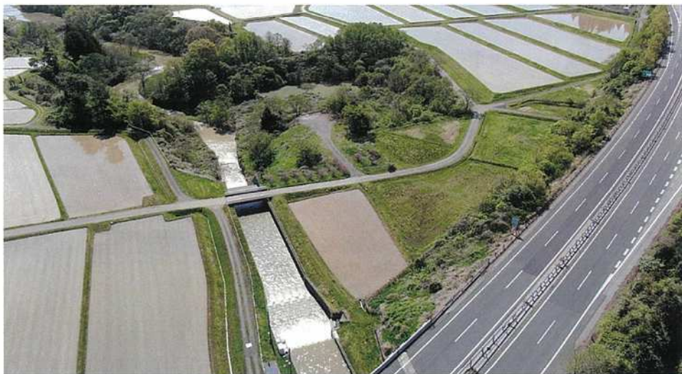
小水力発電の導入を検討している奥州市前沢古城字板子沢地内

採算性の確認ができれば、令和9年度以降に事業計画を策定し、実施設計、工事へと進めてまいりたいと考えております。