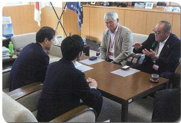
渇水における胆沢ダムの重要性を報告